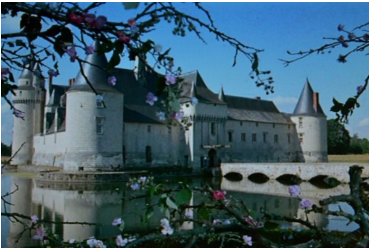
シャンボール城 (Château de Chambord)