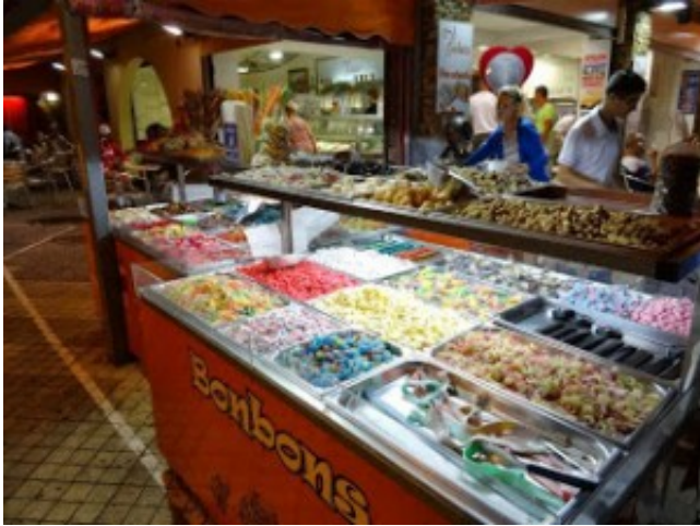
子供にはたまらないボンボン（グミ系の甘いお菓子）コーナー。