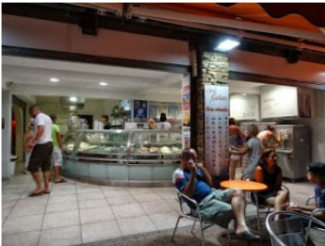
アイスクリーム屋さん。