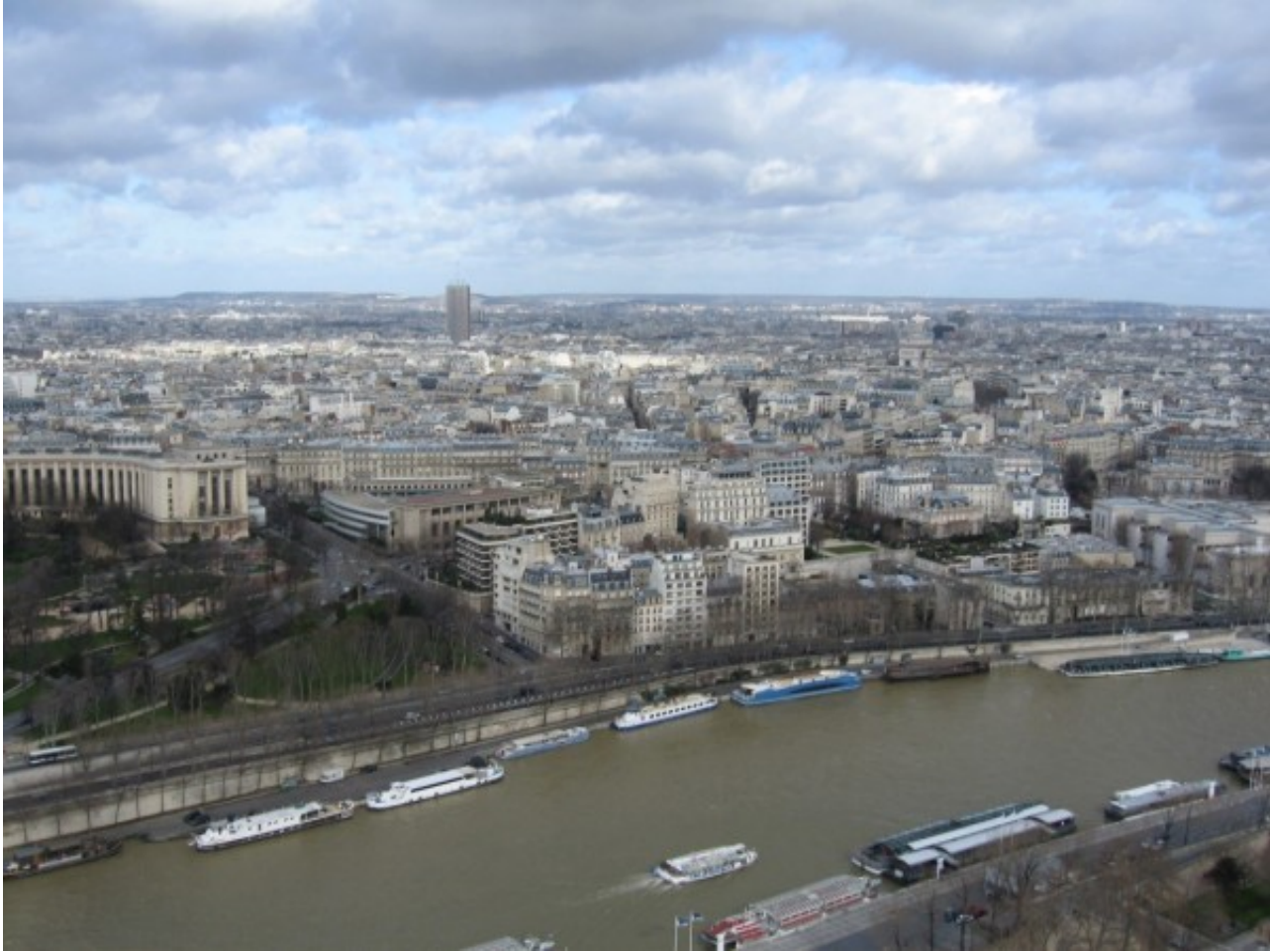
こちらは、セーヌ川