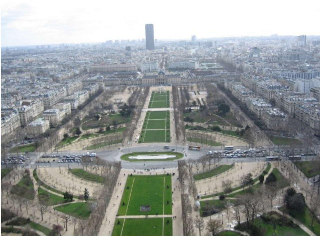
シャン・ド・マルス公園とシャイヨー宮