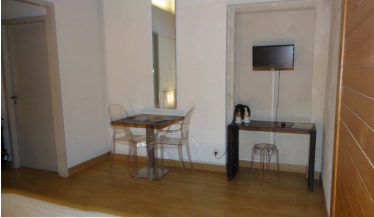
お部屋に到着！！中は広々としています。