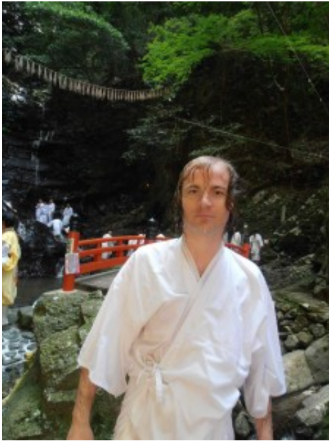
Écrit par 編集部