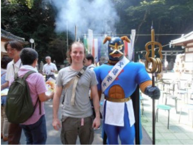
Les mascottes, ne sont elles pas adorables ?