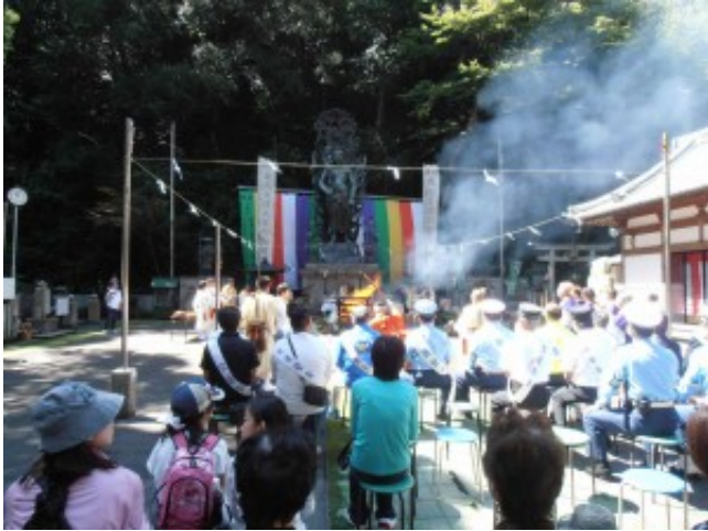
La cérémonie du feu