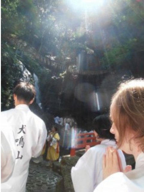
L'épreuve de la cascade, assez éprouvante, mais revigorante.