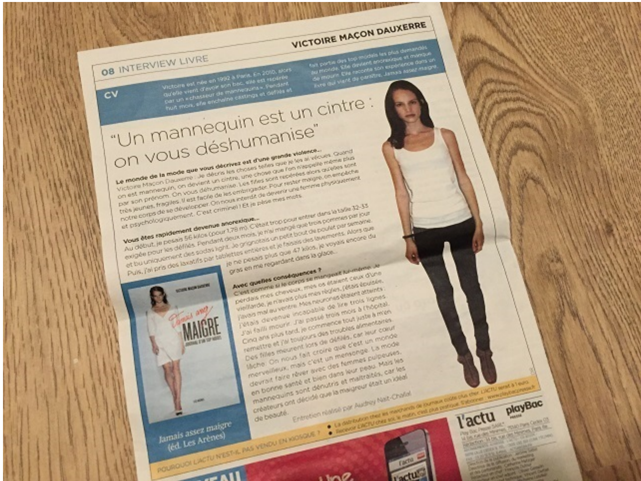
子供新聞 L'actu にも紹介されました (No.4886, 1月19日号 8面)